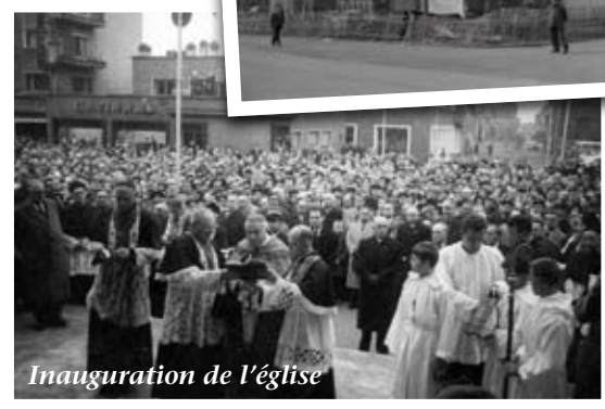
Inauguration de l'église

L urçat introduit à Maubeuge un langage architectural nouveau : toitures-terrasses, maçonneries lisses uniformément passées à l'enduit, prépondérance des lignes horizontales et absence de décor.