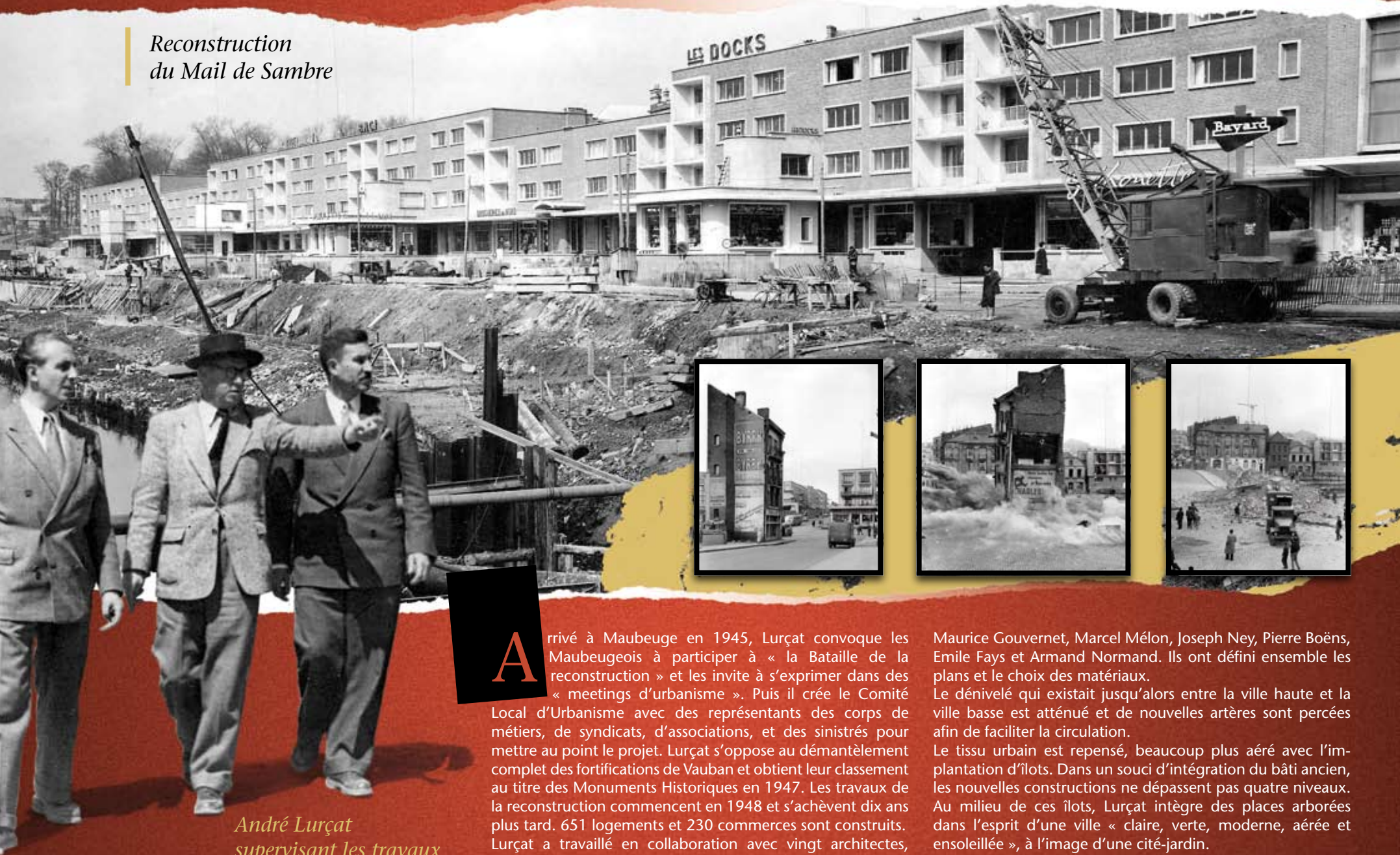
André Lurçat supervisant les travaux